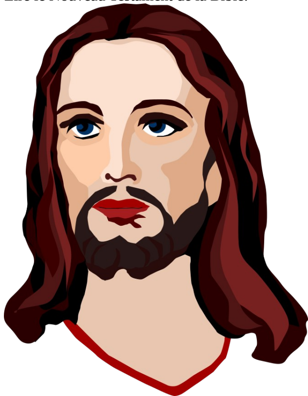
Jésus Christ occidental